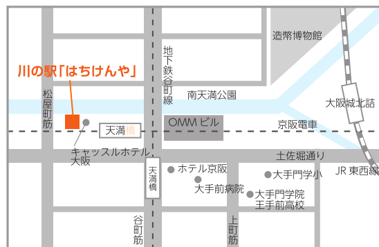
京阪・地下鉄谷町線「天満橋駅」17番出口下車川沿いに西へ約200m